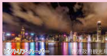
ビクトリア・ハーバー