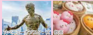
アベニューオブスターズ